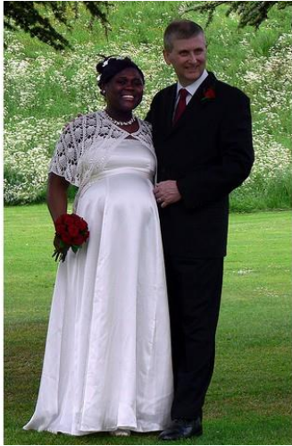
Mama temnejše in oče svetlejše polti