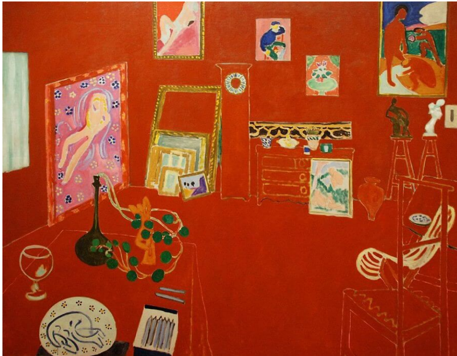
Henri Matisse, Rdeči atelje, 1911 ( www.HenriMatisse.org );