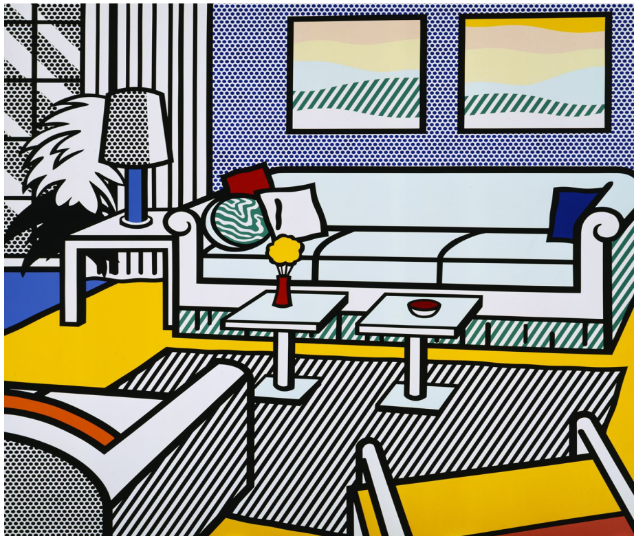
Roy Lichtenstein: Interier s spokojnimi slikami, 1991 (Museo Coleção Berardo)