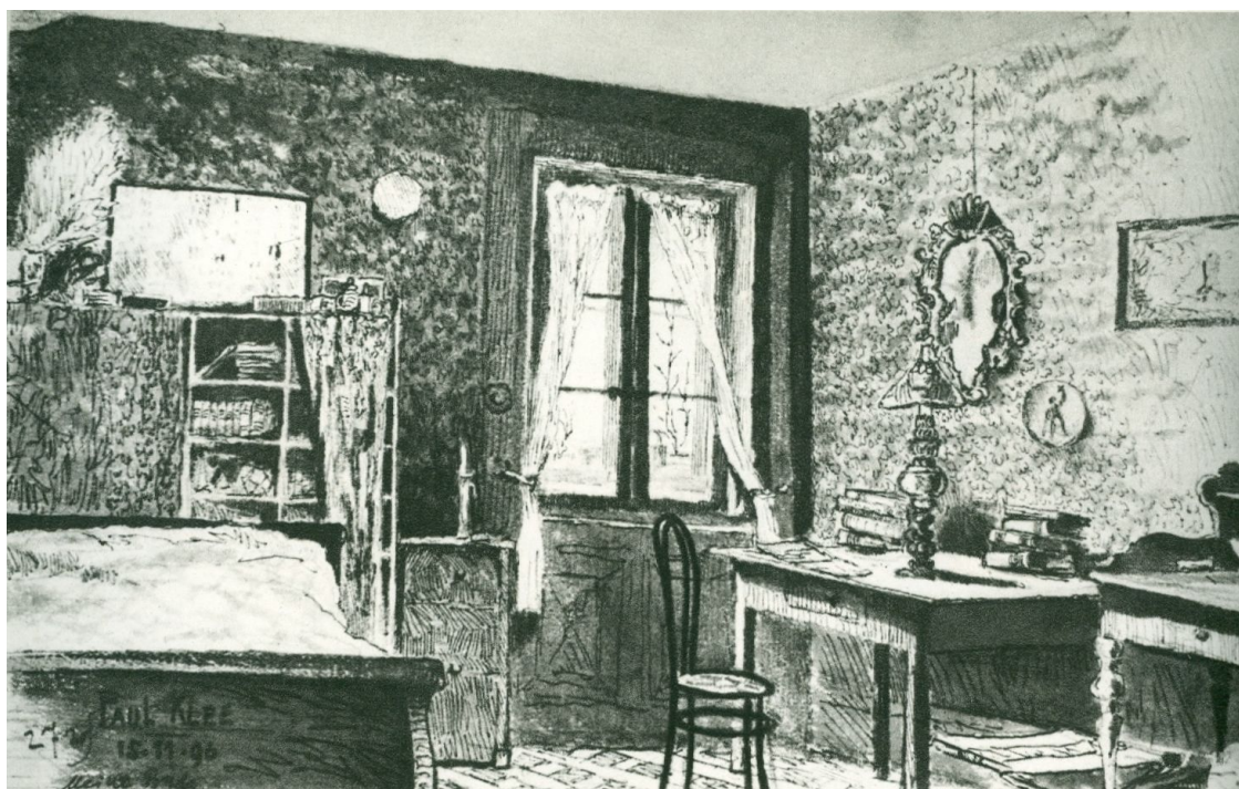
Paul Klee: Moja soba, 1906 (Wikipedia);