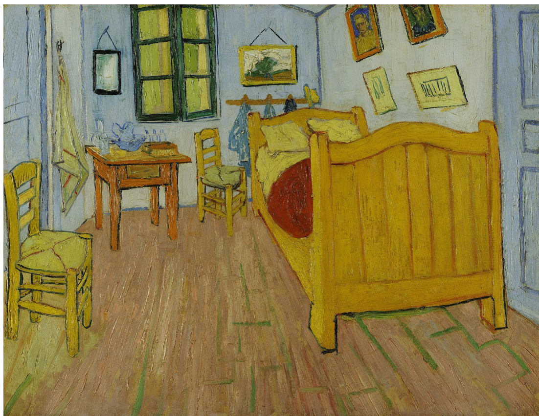
Vincent Van Gogh, Spalnica v Arlesu, 1888

Za inspiracijo pa si oglejte nekaj reprodukcij umetniških del: