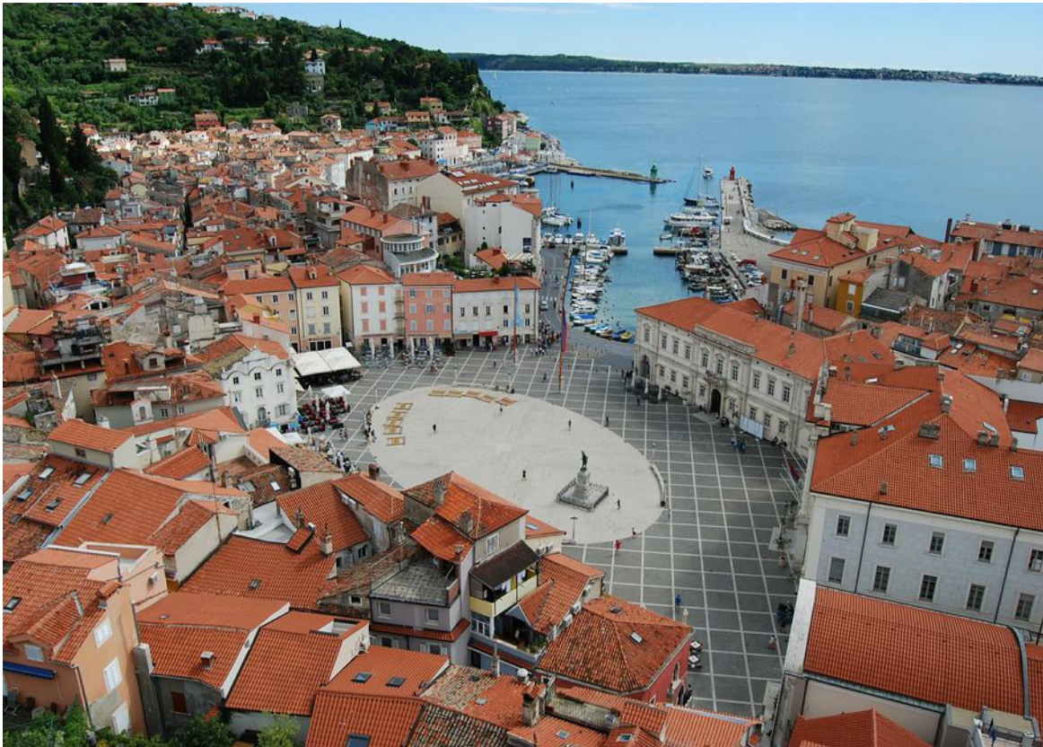
Primorsko mesto Piran z osrednjim Tartinijevim trgom

Trg ima v tlorisu obliko elipse oziroma ovala, ki ga obkrožajo pomembne zgradbe, mestna hiša, sodna palača, Tartinijeva rojstna hiša, najstarejša ohranjena hiša na Tartinijevem trgu - Benečanka - in druge stavbe, ki imajo v spodnjih prostorih trgovine, galerije, ateljeje, gostinske lokale, zgoraj pa stanovanja. Te so postavljene zelo gosto, med njimi so ozke ulice, po katerih prideš le peš. Trg je manjši od prejšnjega in ima drugačen namen. Galerije, trgovinice, bari s svojimi preprostimi fasadami skupaj s kipom, ki nosi lokalno zgodbo, ustvarjajo priljuden in romantičen prostor v tem primorskem kraju.