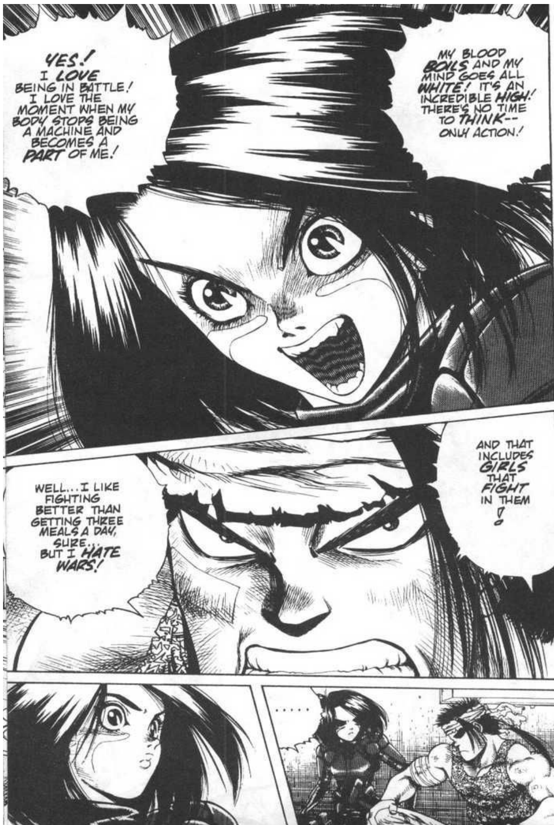
Gunnm (Alita) Yukito Kishiro, japonski manga strip, podobno kadriran kot akcijski filmi