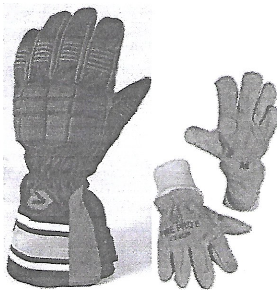
Gasilske zaščitne rokavice

Gasilske zaščitne rokavice so narejene iz enakih materialov kot zaščitna bluza ter podaljšane, da lahko v kombinaciji z rokavi bluze zaščitijo tudi zapestje.