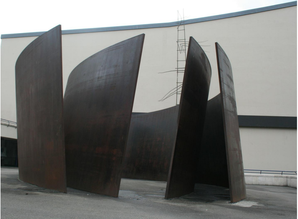
Richard Serra, Intersection 1992, korten, Basel

Richard Serra (1939) je ameriški minimalistični kipar in video umetnik, znan po kipih iz jeklenih plošč. V začetku leta 1960 je začel uporabljati nekonvencionalne, industrijske materiale in poudarjati njihove fizikalne lastnosti, predvsem njihovo grobo, surovo teksturo. Svoje skulpture iz ogromnih jeklenih plošč je postavljajal v urbane prostore, kjer so prav zaradi svoje monumentalnosti na gledalce veličastno delovali. Tako se je na svojstven način vzpostavljajal odnos med telesom gledalca in skulpturo v prostoru.