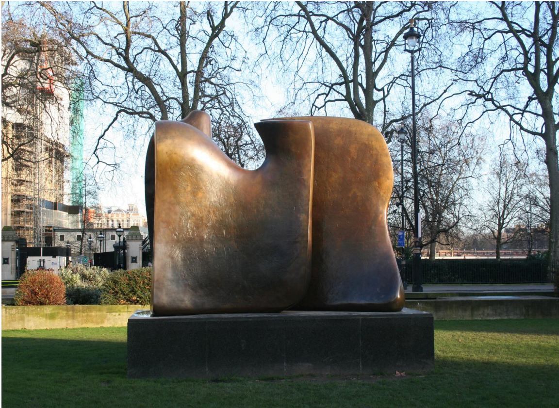
Henry Moore, Knife Edge Two Piece , bron, 1962-65, London

Henry Moore (1898-1986) je najslavnejši britanski kipar 20. stoletja. Najbolj znan je po bronastih kipih, ki so javno razstavljeni na številnih delih sveta. Oblike njegovih skulptur so navadno upodobitve človeškega telesa, ki so močno poenostavljene, kar abstrahirane. S svojo obliko spominjajo na mehko zaobljene hribe Yorkshira, pokrajine, v kateri je bil rojen. Uporabljal je kamen, bron in v zadnjem obdobju tudi les.