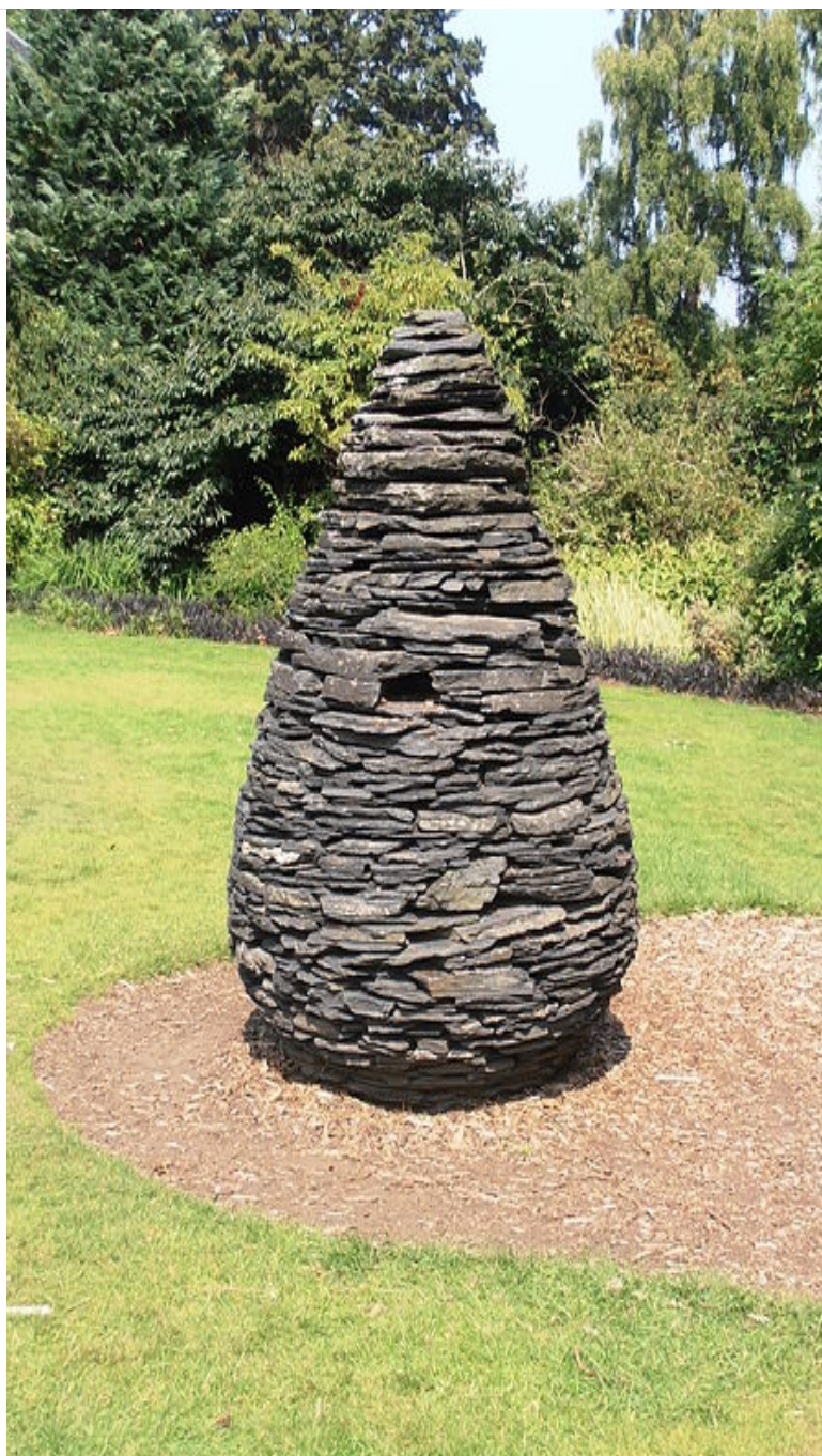
Andy Goldsworthy, Cone, 1990, Royal Botanic Garden, Edinburgh

Abstraktna dela ustvarjajo tudi umetniki, ki delujejo v naravnem prostoru, velikokrat na odmaknjenih krajih, daleč od ljudi. Takšna umetniška dela so minljiva, saj nanje delujejo podnebne razmere in letni časi. Ohrani jih fotografija.